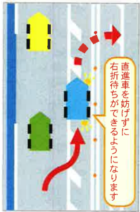
図1 『右折緩衝帯』を設置すると